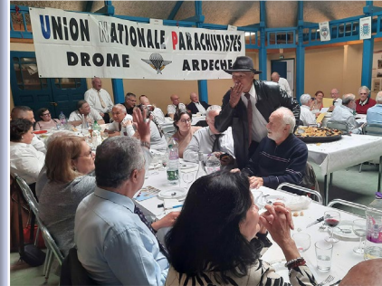
Un repas convivial