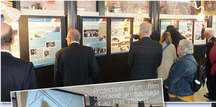
Projection d'un film consacré au bachaga et au Mas Thibert