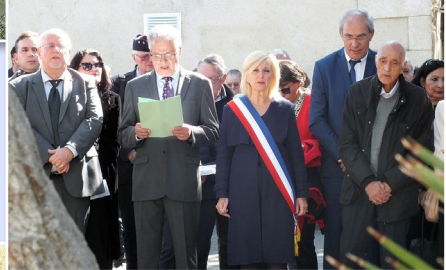
Le chant des Africains