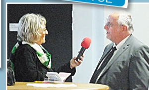
Séance d'interview, par une journaliste de RCF