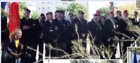
Nos amis parachutistes et anciens combattants